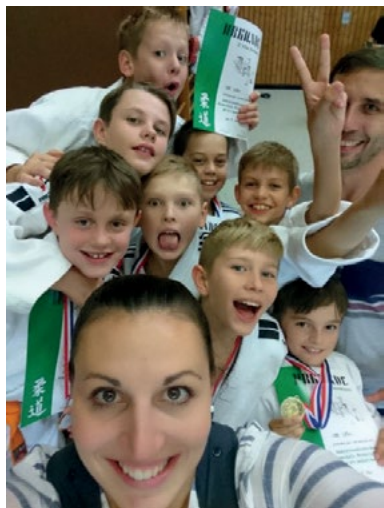
Mannschaft U12 Süd-Württembergische Meisterschaften