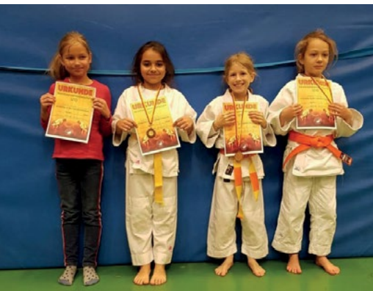
Teilnehmer Bezirksmeisterschaften U10