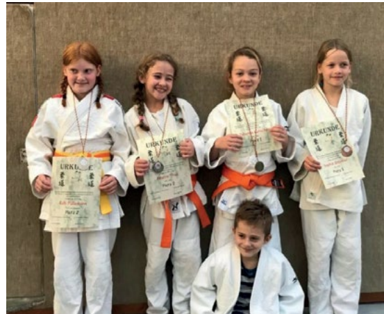
Teilnehmer Süd -Württembergische U10