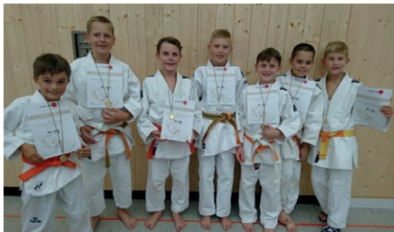
Mannschaft U12 Bezirksmeisterschaften