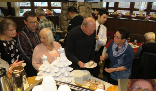
Der Seniorennachmittag 2018 in Bildern