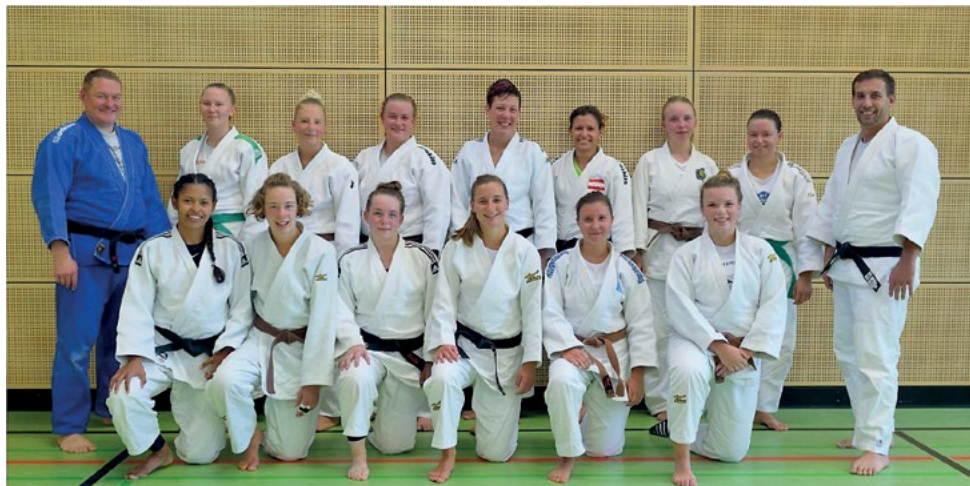
Vorbereitungstraining für die 2. Bundesliga

Im Mai 2018 gewann die Frauennmannschaft vom VfL Ulm die Württembergliga und qualifizierte sich somit für den Aufstieg in die 2. Bundesliga Süd. Im kommenden Jahr wird daher, anstatt der bisher fünf, in sieben Gewichtsklassen gekämpft. Die Mannschaft verstärkt sich aktuell mit Kämpferinnen aus den umliegenden Vereinen.