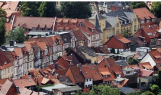
Wernigerode, Sicht vom Schloss

Wer durch den Bericht Appetit auf einen Ausflug in dieses Städtchen bekommen hat, nur zu. Es hat seinen Erlebniswert.