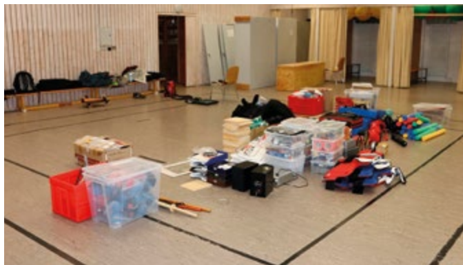
Der Weg zum neuen Hallenboden